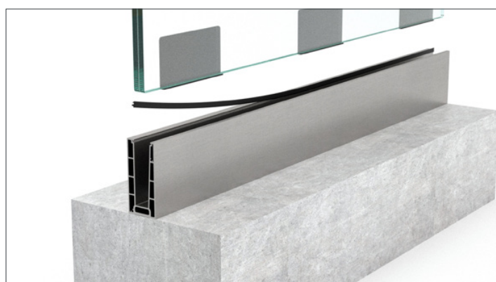
3. Monter frontgummi og sæt 3 vinkler i pr. meter. Løft glasset på plads.