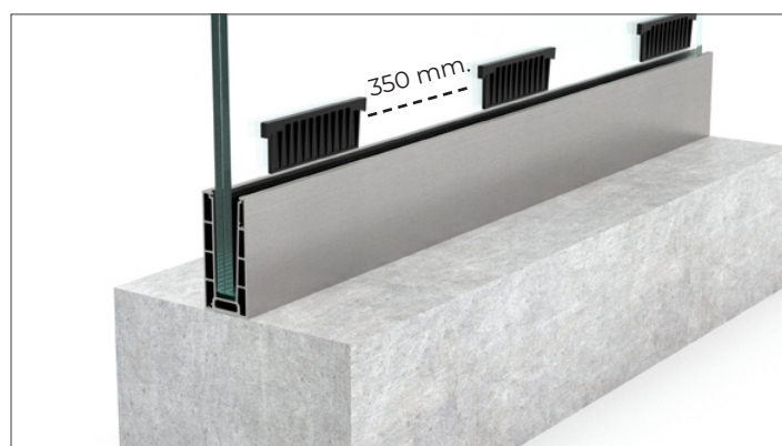
4. Sæt 3 kiler i pr. meter ud for vinkler.