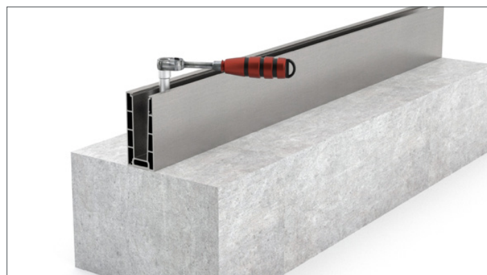
2. Placere skinne og spænd den fast.