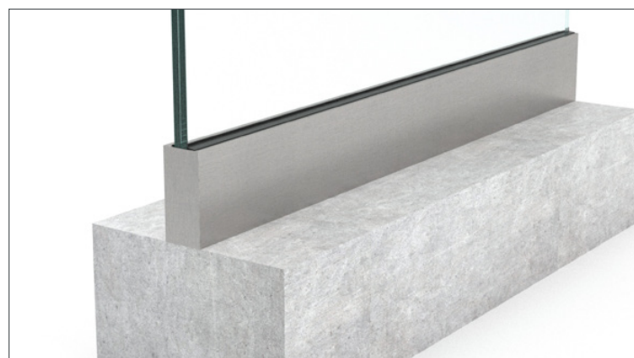
6. Det færdige resultat.