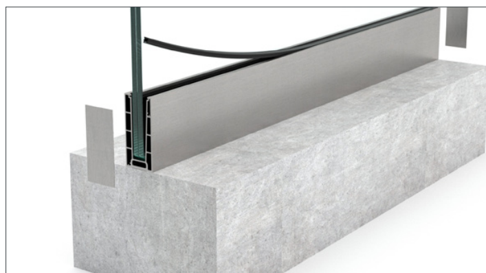
5. Monter sidste gummi og endekapperne.